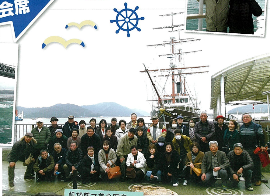
帆船前で集合写真