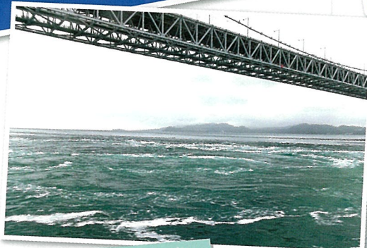
鳴門海峡のうずしお