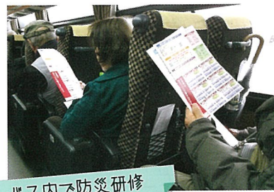
バス内で防災研修