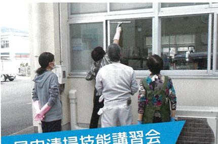
屋内清掃技能講習会

令和9年1月12日(火)開催予定の「果樹剪定技能講習会」は、諸事情により中止となりました。