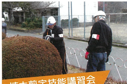
植木剪定技能講習会