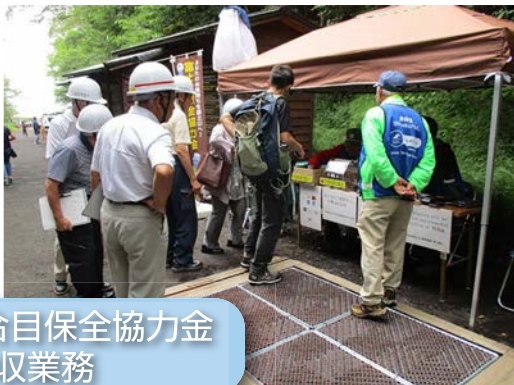
富士山五合目保全協力金 徴収業務