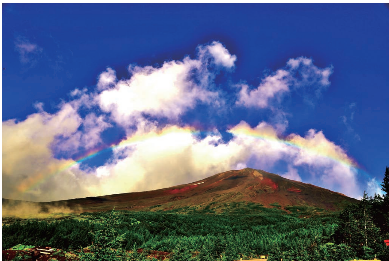
須走口第2駐車場より（富士山にかかる虹）