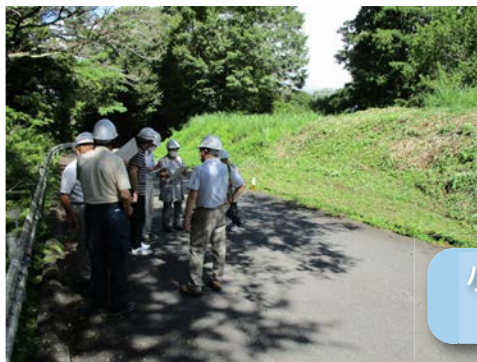
小山町新柴地先 草刈り業務