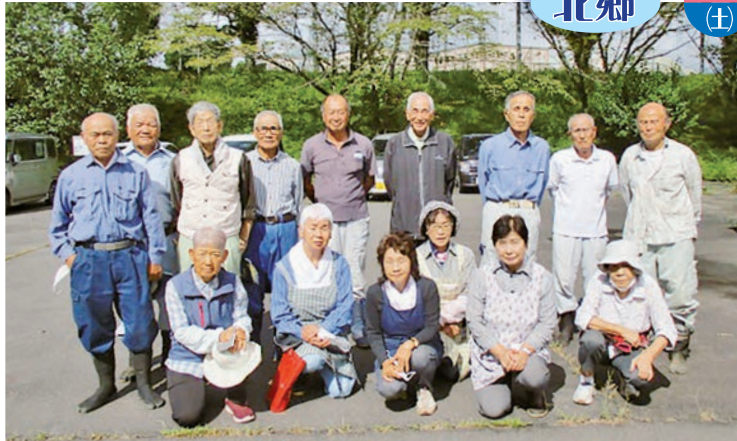
旧シルバー人材センター駐車場