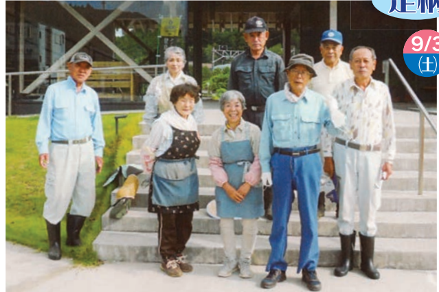
足柄駅前ロータリー