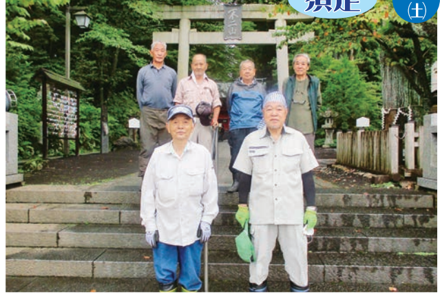
須走富士浅間神社