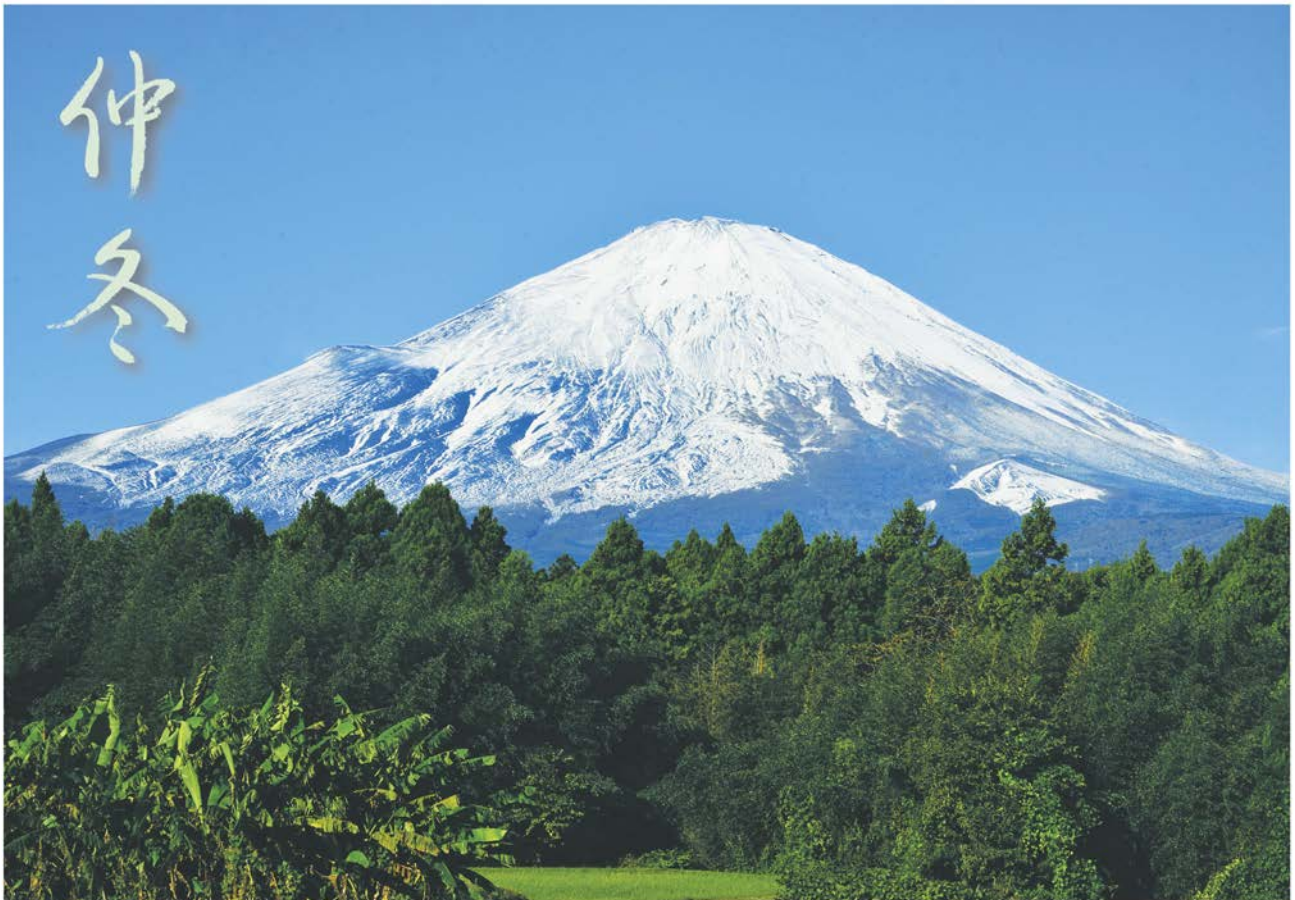
10月26日、雪がたくさん降った翌朝に 総合文化会館付近から富士山を望む