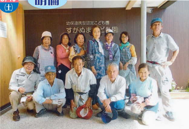
すがぬまこども園