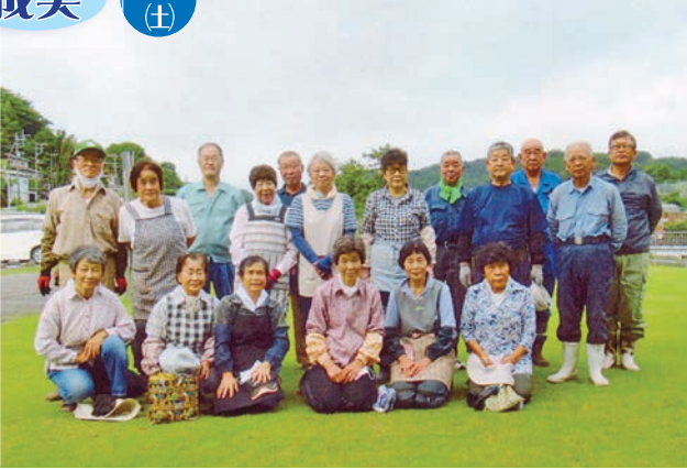
小山町健康福祉会館