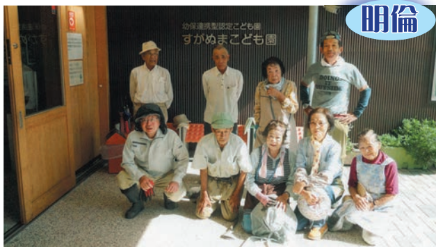
すがぬまこども園