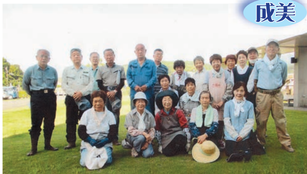
小山町健康福祉会館