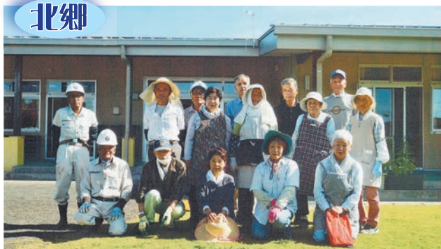
きたごうこども園