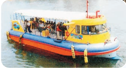
半潜水艦式観光船にじいろさかな号。 荒天のため乗船できず、とても残念～！