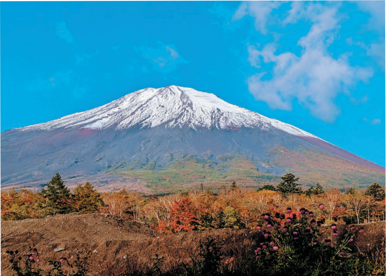
ふじあざみライン 馬返し

公益社団法人 小山町シルバー 人材センター 〒410-1312 静岡県駿東郡小山町 菅沼1074-1 小山町シルバーワークプラザ内 TEL (0550) 78-6266 FAX (0550) 78-7886