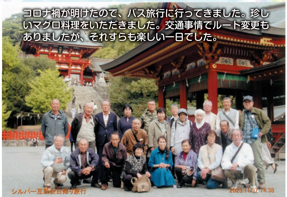
シルバー互助会日帰り旅行