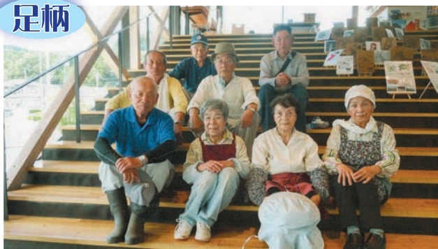
足柄駅前ロータリー