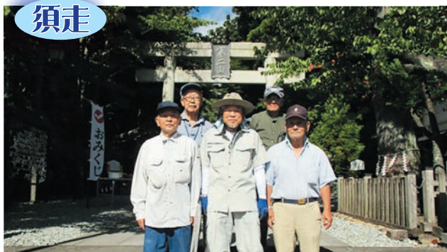
須走富士浅間神社