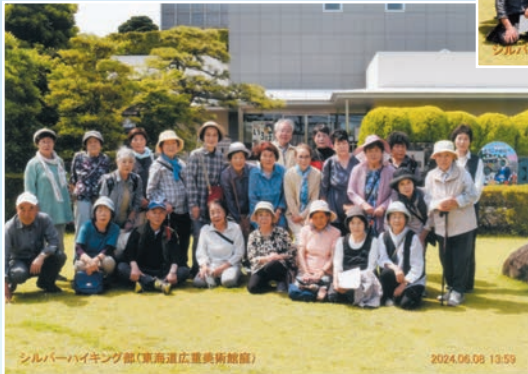
シルバーハイキング部(東海道広重美術館) 2024.06.08 13:59

六月八日に清水港水上バスで江尻のりばから出港し、三保のりばを回って日の出のりばで下船しました。 日の出棧橋には、朝八時に入港して夕方出港する「チャイナ・マーチャント・アデン（中国）」四万七千トンが停泊していました。この船はダイヤモンド・プリンセスの約半分分の重さですが、全長が約二百二十八メートルあります。いつかクルーズで船の旅をしてみたいです。