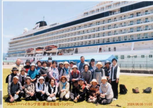
シルバーハイキング部(豪華客船セパグニ) 2024.06.08 11:03