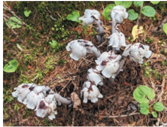
ギンリョウソウ(銀竜草) 幽霊草ともいわれます!