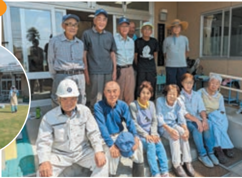
きたごうこども園