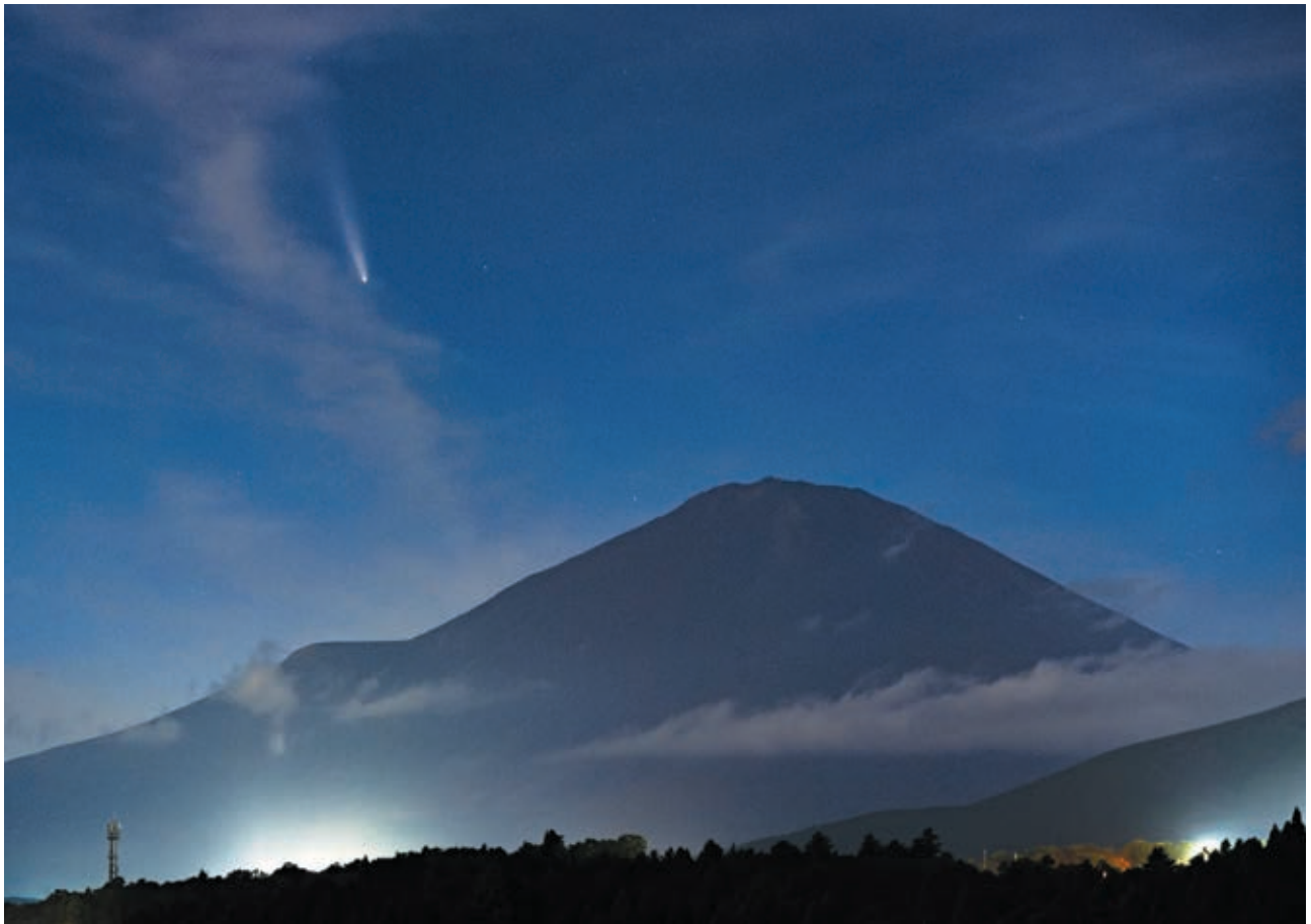
小山町上野から今野剛典氏撮影（2024年10月15日 紫金山・アトラス彗星）