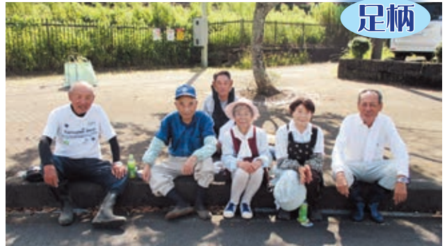
足柄駅前ロータリー