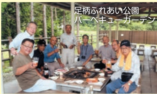
足柄ふれあい公園 バーベキューガーデン

九月二十九日の懇親会に九人の参加がありました。来年のことを言うと鬼が笑うと言いますが、外国人登山者増加に伴い、海外経験があるなど外国語の話せる会員が増えると心強い。また、ボケ防止、自分の為、五合目の為に英会話教室を受けてから対応したいと話題に上がりました。世間話で、六十・七十歳代の普段人に言えない、ネット通販、知らない人からのメールや着信の失敗談をし、俺は大丈夫と思っている人は危ないと勉強になりました。