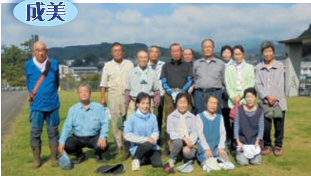
小山町健康福祉会館