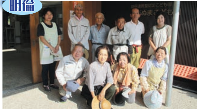
すがぬまこども園