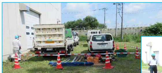
コーンで作業車両を囲い安全確保している

安全委員会では年4回の安全巡回を実施します。 第1回の安全巡回は7月10日に行われ、委員は 2班に分かれて、屋外の作業現場を巡回しました。