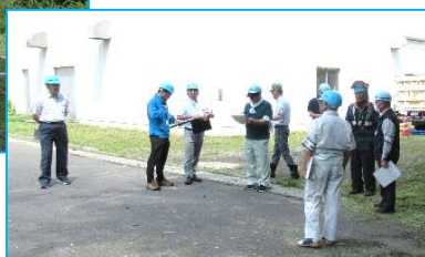
巡回する安全委員