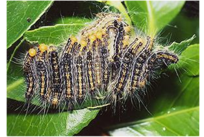
公益社団法人農林水産・食品産業技術振興協会

チャドクガは、基本的には5月～6月頃と8月～9月頃の年2回発生します。ツバキやサザンカ、チャなどのツバキ科の樹木に発生します。