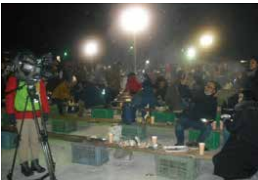
焼き肉の煙が立ち込め、祭りは最高潮！テレビ局も取材！

この日、派遣された会員は、この冬のイベント以外に、夏の「花火大会」や秋の「菊まつり」など地元の大きな行事の際には、『シルバーパワー』を発揮し、地域愛に満ちた活躍を続けている。