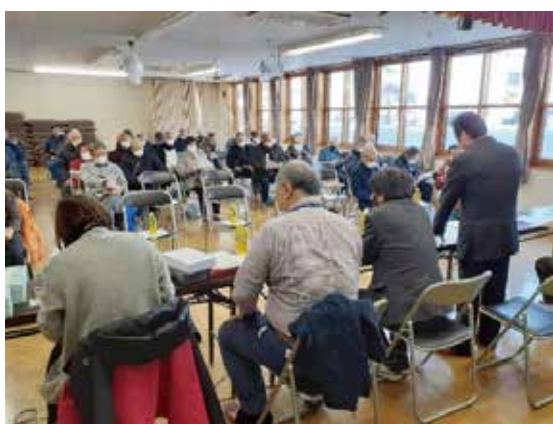
理事長の挨拶に、熱心に耳を傾ける5地区の会員の皆さん

最後に、班会議を行い、新年度の班長が選出された。また、今一度、「気配り」ある作業行動を全員で共有し、令和5年度の事業に向けた体制が整えられた。