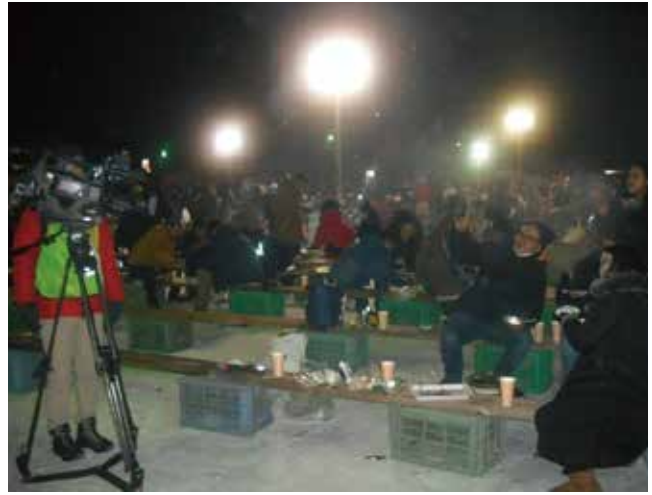
北見名物 「厳冬の焼肉祭り」より