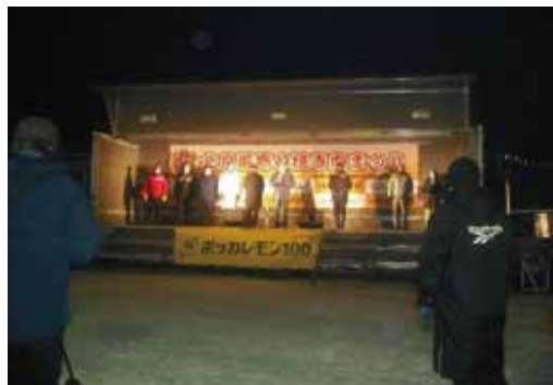
舞台では、抽選や地元アイドルのライブなどが行われた