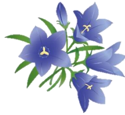
リンドウの花言葉 「誠実」