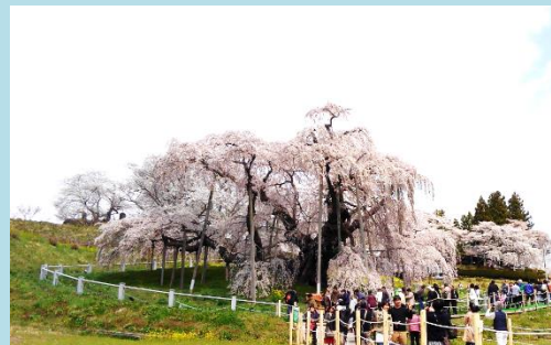
明田 雅好 三春の滝桜

短歌・俳句・川柳・絵手紙・写真・書道・手芸・スケッチ等の投稿をお待ちしています。第47号以降に掲載します。投稿につきましては、会員番号・氏名を添え、事務局までお寄せください。