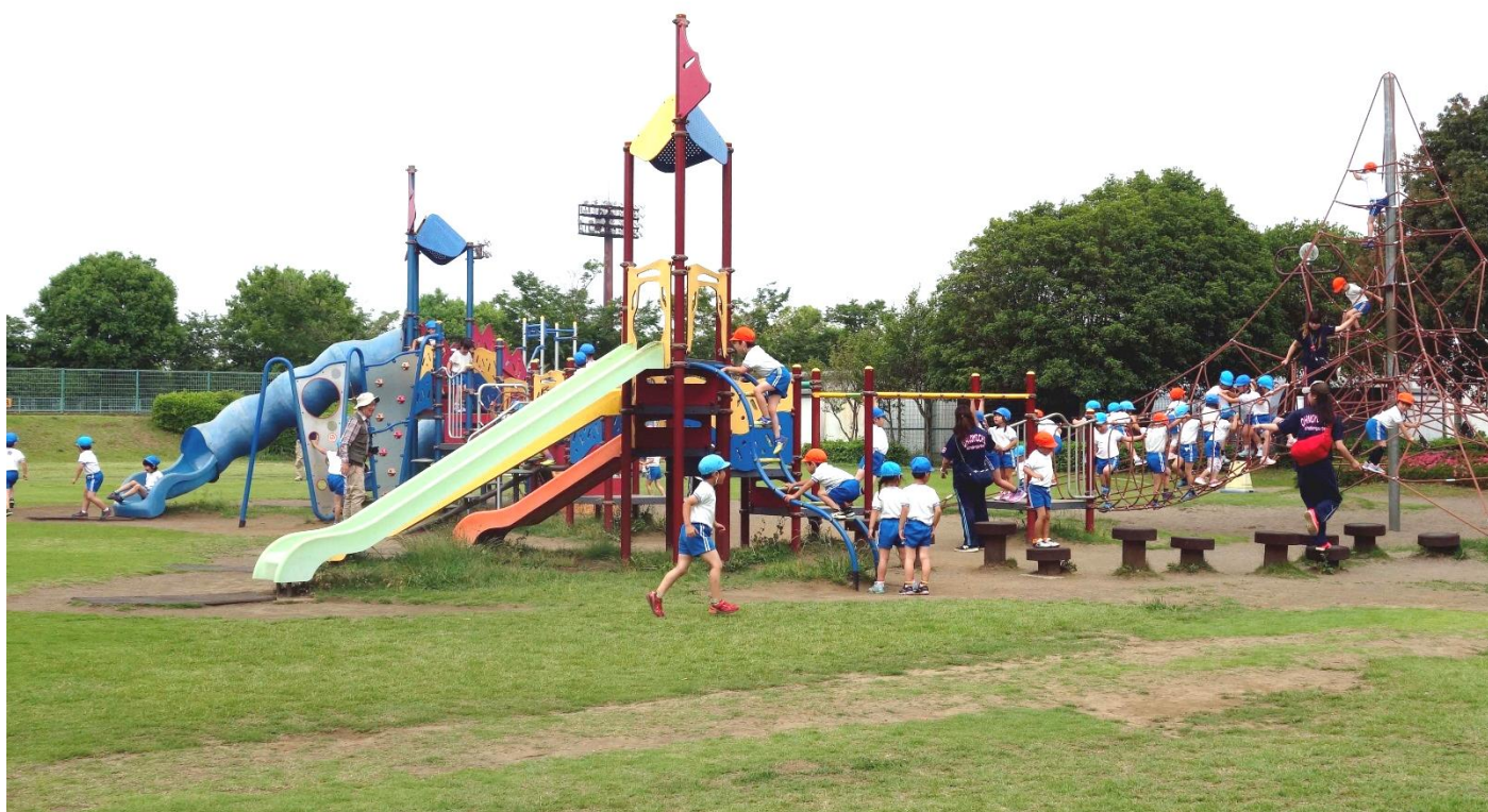
北本総合公園（北本市古市場 1-167）

第 46 号 平成 30 年 7 月発行 公益社団法人 北本市シルバー人材センター 〒364-0013 埼玉県北本市中丸 10-55 電話 048-592-4300 FAX 048-593-2759 kitamoto-sc@sjc.ne.jp