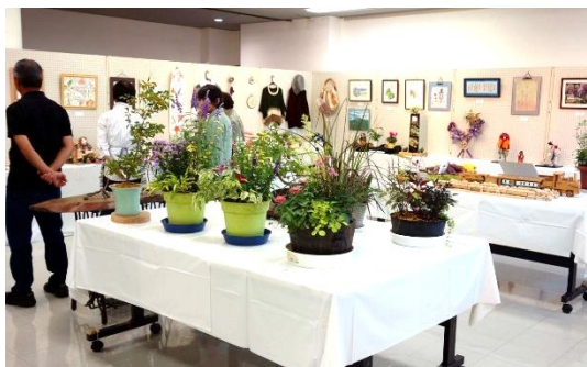
会員作品展の様子

シルバー人材センターは仕事だけでなく仲間作りの場ともいいます。新しい出会い、会員同士の交流を深める場としてみてはいかがでしょうか。