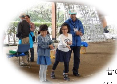
昔の遊び (竹とんぼ)