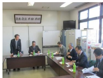
農園視察受け入れ