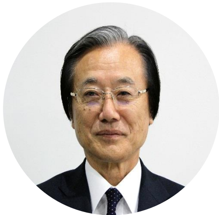
北本市長 現王園 孝昭