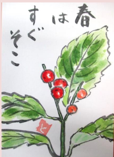
三上 智恵 「絵手紙」

短歌・俳句・川柳・絵手紙・写真・書道・手芸・スケッチ等の投稿をお待ちしています。第48号以降に掲載します。投稿につきましては、会員番号・氏名を添え、事務局までお寄せください。