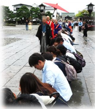
お数珠頂戴に遭遇