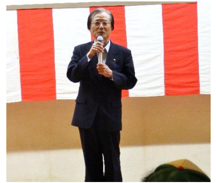
北本市長 現王園 孝昭氏