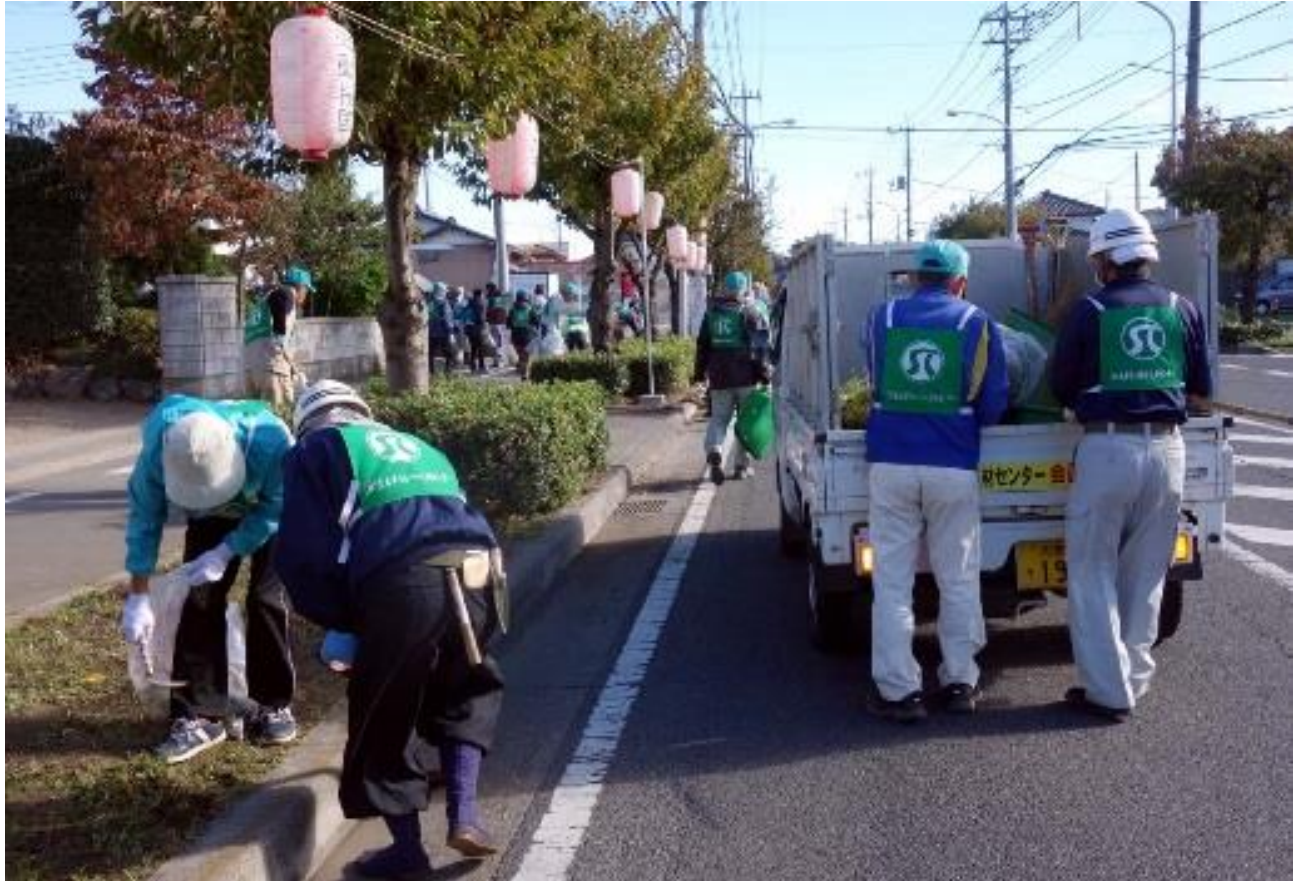
平成30年度西中央通線ボランティア清掃

〒364-0013 埼玉県北本市中丸10-55 電話 048-592-4300 FAX 048-593-2759 http://webc.sjc.ne.jp/kitamoto