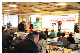
カラオケ発表会の模様

短歌・俳句・川柳・絵手紙・写真・書道・手芸・スケッチ等の投稿をお待ちしています。第48号以降に掲載します。投稿につきましては、会員番号・氏名を添え、事務局までお寄せください。