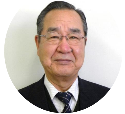
北本市長 現王園 孝昭