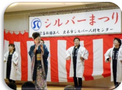
歌手 浅倉 みよ子