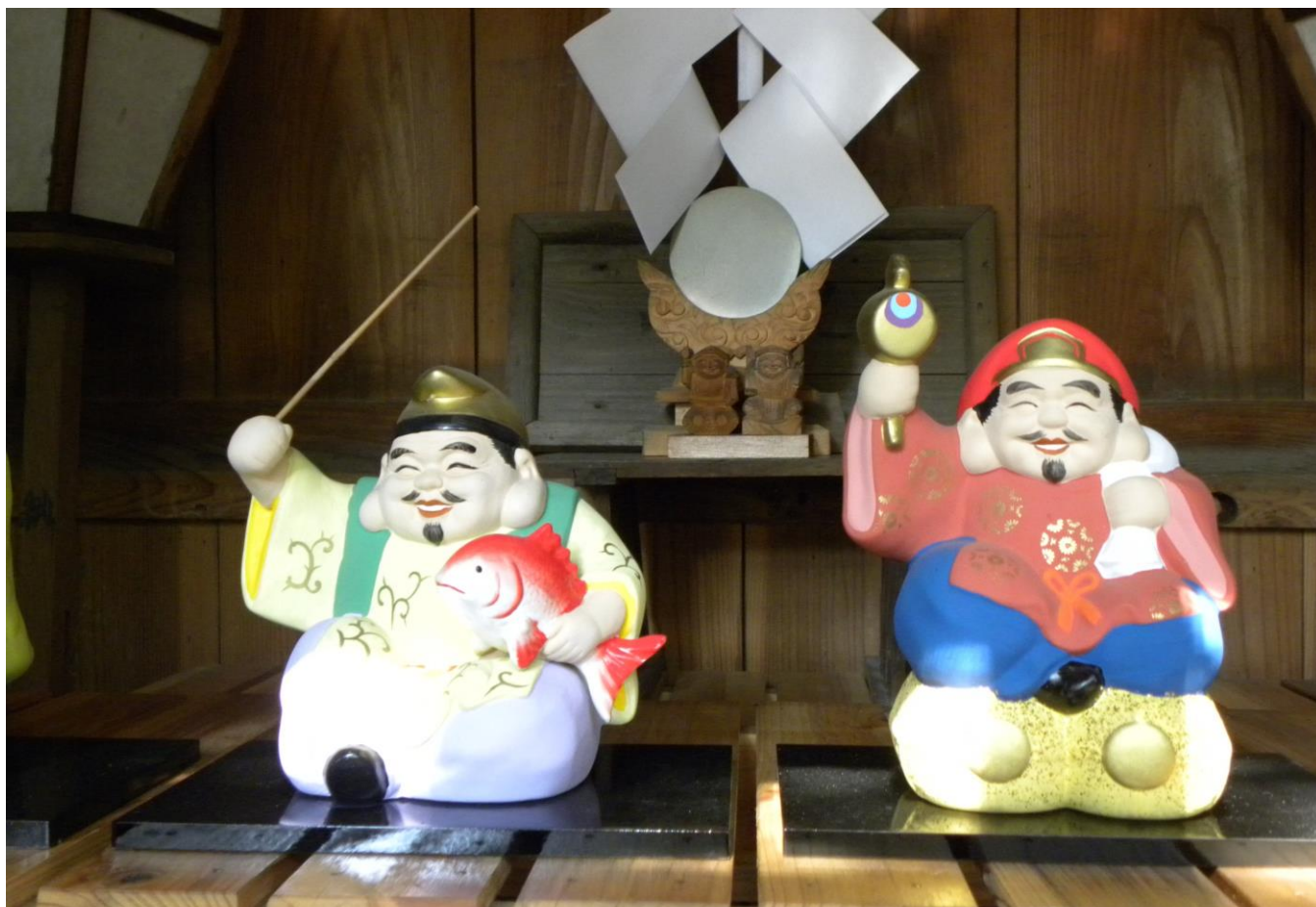
北本七福神 大黒天・恵比寿（高尾氷川神社）

第 43 号 平成 29 年 1 月発行 公益社団法人 北本市シルバー人材センター 〒364-0013 埼玉県北本市中丸 10-55 電話 048-592-4300 FAX 048-593-2759 http://www.sjc.ne.jp/kitamoto/