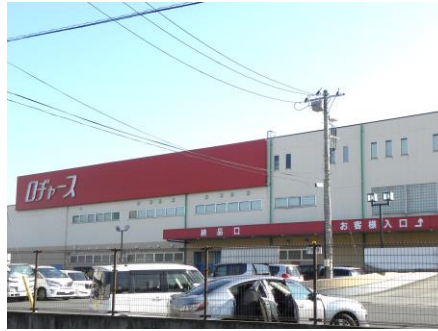
ロチャース北本店