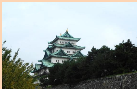
「名古屋城」 明田 雅好