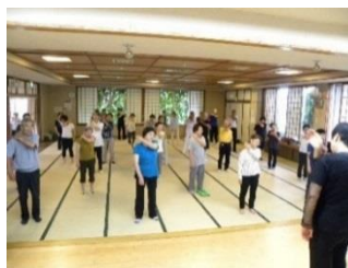
健康いきいき体操