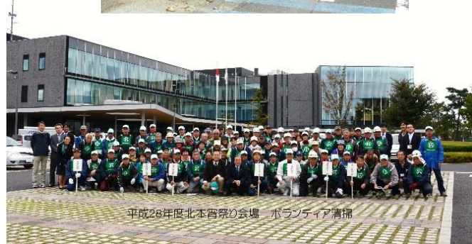
平成28年度北本まつり会場 ボランティア清掃