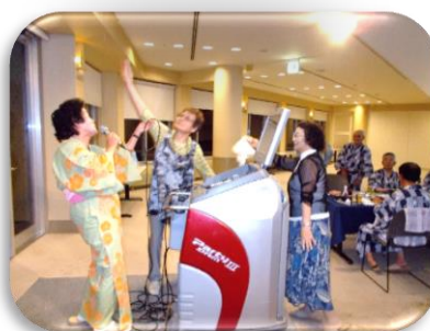
歌って踊って三人娘