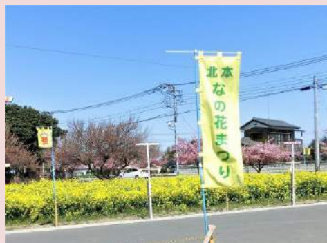
滝瀬 喜一 北本 なの花まつり