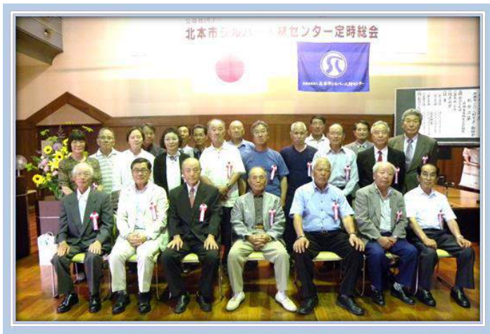
定時総会に出席された表彰者の皆さん

続いて、報告第2号「平成29年度事業計画の報告について」木暮理事から説明があり、報告第3号「平成29年度収支予算書の報告について」は関谷理事から説明がありました。 新年度事業については、昨年度に引き続き市からの委託を受け「アクティブシニア社会参加支援事業」の実施をはじめ、農園事業の拡大、中期5カ年計画の具現化に取り組んでいくことなどが報告されました。