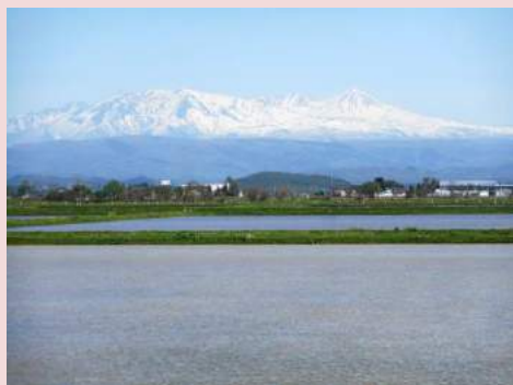
明田 雅好 田園風景と大雪山連峰

短歌・俳句・川柳・絵手紙・写真・書道・手芸・スケッチ等の投稿をお待ちしています。投稿につきましては、会員番号・氏名を添え、事務局までお寄せください。