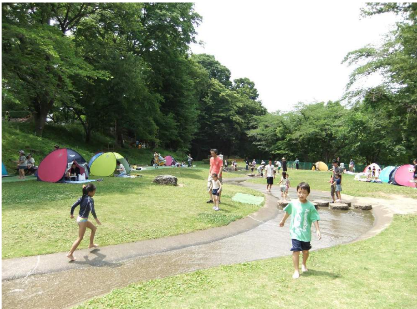
北本市子供公園 (撮影 広報部会)

第 44 号 平成 29 年 7 月発行 公益社団法人 北本市シルバー人材センター 〒364-0013 埼玉県北本市中丸 10-55 電話 048-592-4300 FAX 048-593-2759 kitamoto-sc@sjc.ne.jp