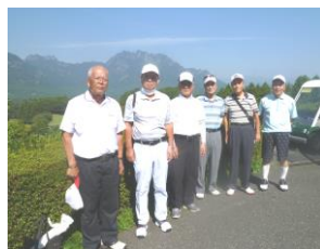
暑気払い「ゴルフコンペ」 「妙義連峰」を背景に