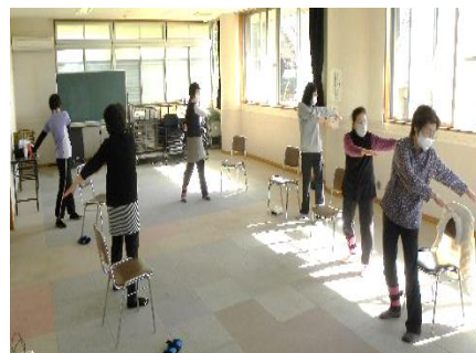
イキイキとまちゃん体操