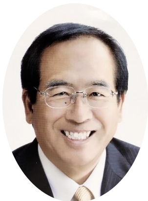
北本市長 三宮 幸雄