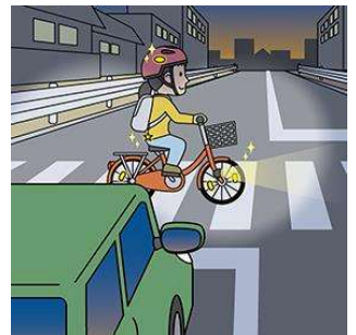
夜間はライト点灯