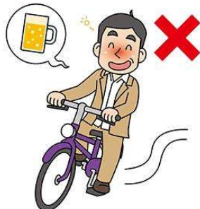
酒酔い運転は禁止