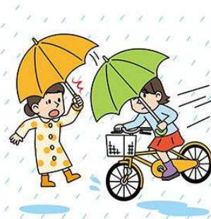
傘さし運転等 片手運転の禁止