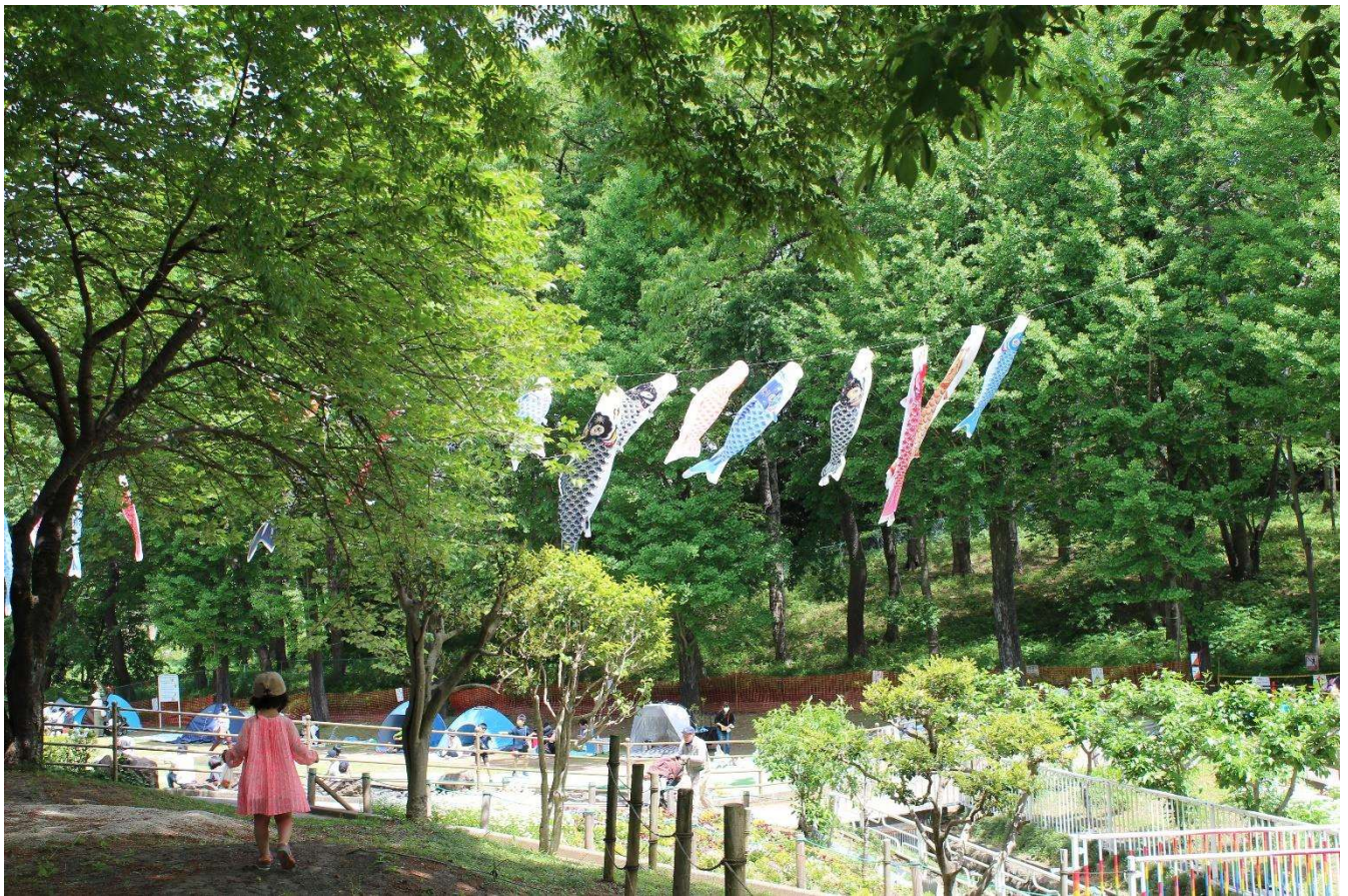
『こどもとみどりのフェスティバル』 北本市子供公園