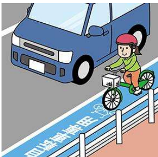
原則車道を走行 左側通行

自転車事故で亡くなった方のうち、半数以上の方が頭部に致命傷を負っています。自分自身の命を守るため、自転車に乗る場合はヘルメットを着用しましょう。