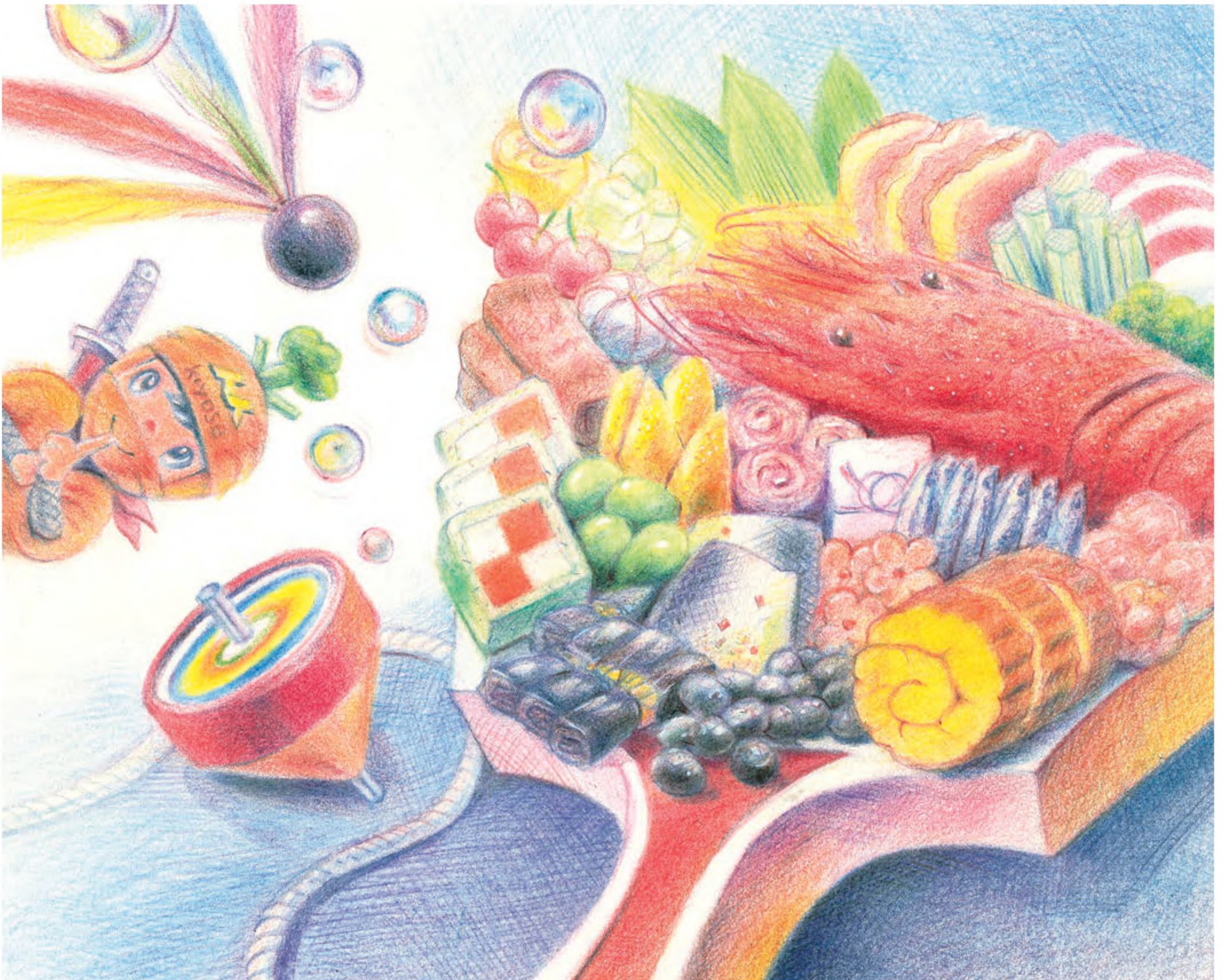
(画 松山地域班 山下 弘)