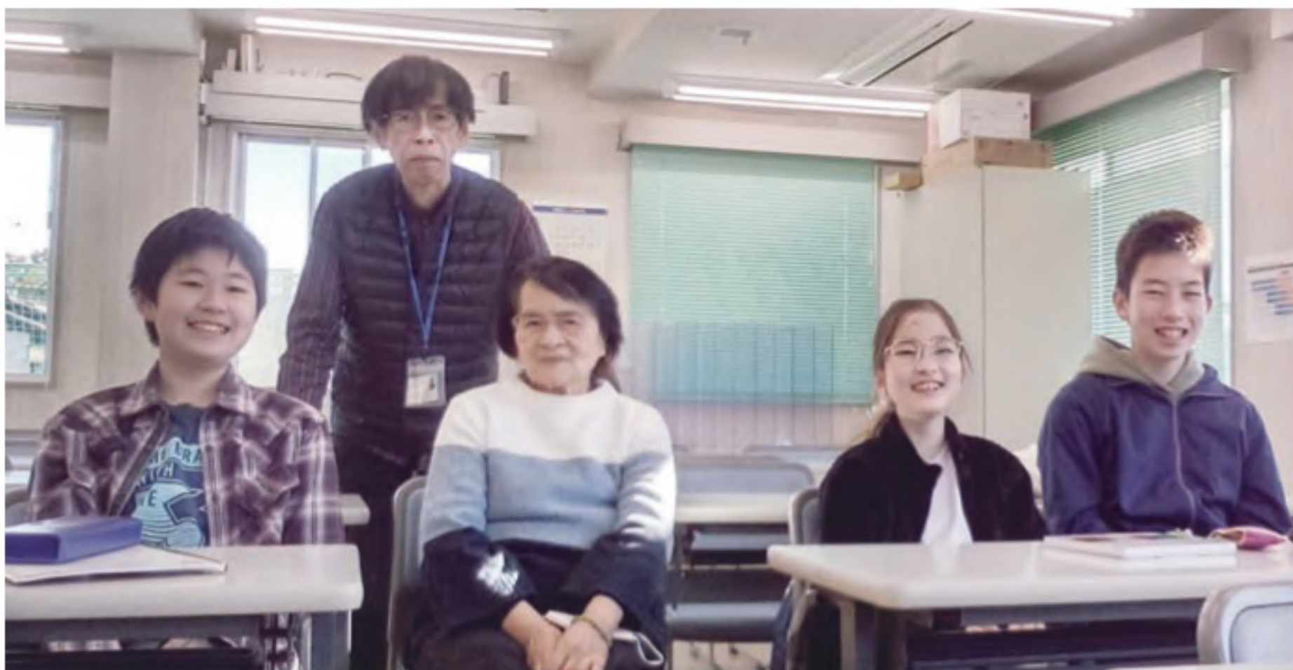
色えんぴつ教室風景