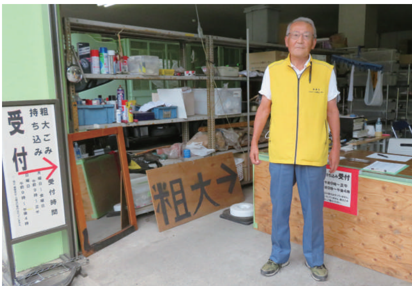
(粗大ごみ持込受付就業会員)