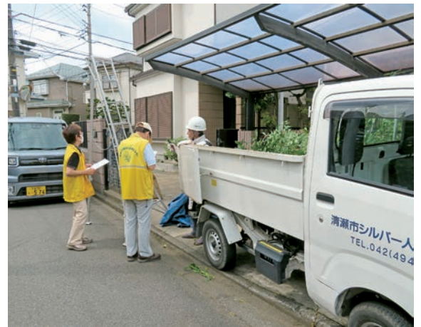
現場巡回パトロール風景