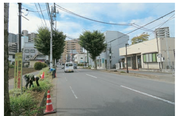
右側の植え込みは作業後 スッキリときれいに!

掃で簡単な作業ですが、長年内勤業務 だったのではしばらくは大変でした。し かし良い先輩にも恵まれ身体も慣れて きて今では問題なく作業しています。 そもそも清掃などで汚れたところを きれいにするのは好きなので、雑草や枯葉、小枝を清掃後に作業 前と比べると達成感があります。これ からも除草作業を続けるつもりです。