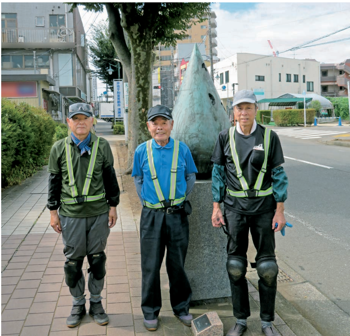
(清瀬市道路清掃業務就業会員)