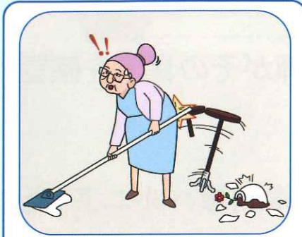
就業中に誤って財物を壊してしまった

就業中に他人の財物や身体を害し、賠償責任を負担する場合の補償です。自動車の所有、使用または管理に起因する賠償責任は対象外です。