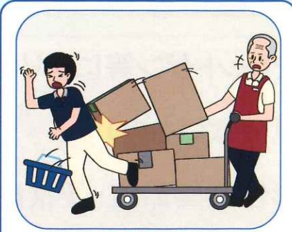
就業中に誤って他人のけがをさせてしまった