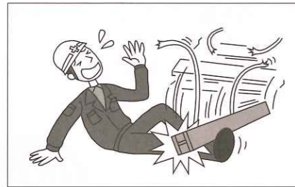
センターから提供された業務に就業中のケガ (ただし住居で仕事に従事する場合を除きます。)

(1) 対象となる傷害事故例 (急激かつ偶然な外来の事故によるケガが対象となります。)