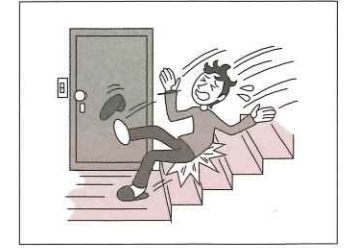
事務所施設の欠陥により 他人にケガをさせた (施設所有管理者特約)