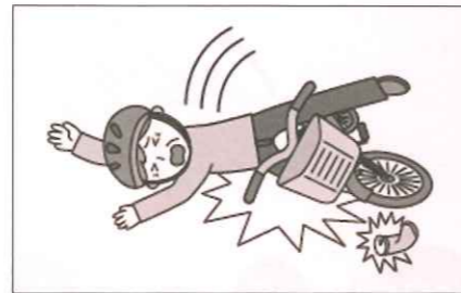
センターから提供された業務に従事するため、就業場所と会員の住居との間の行き帰り中のケガ

※ 傷害事故の他に、熱中症(日射または熱射によって、シルバー人材センターの会員が身体に障害を被った場合)による死亡・後遺障害・入院(手術)・通院も補償します。『請負就業・派遣就業ともに対象です。』