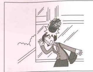
作業中、誤って物を落とし 通行人にケガをさせた (請負業者特約)