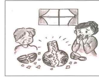
作業中、誤って花瓶や 鉢を壊した (受託者特約)