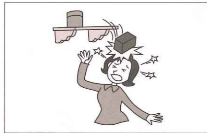
センター等が主催するボランティア活動に参加中のケガ