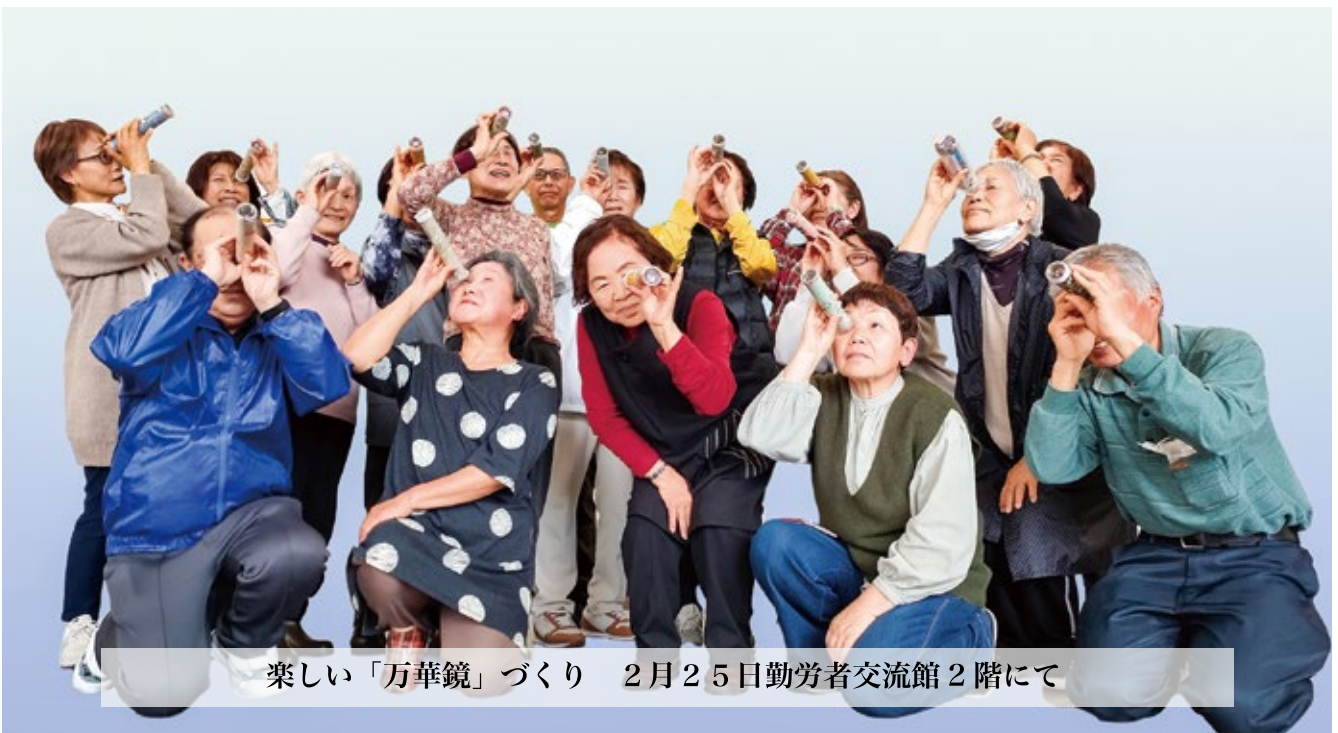
楽しい「万華鏡」づくり 2月25日勤労者交流館2階にて