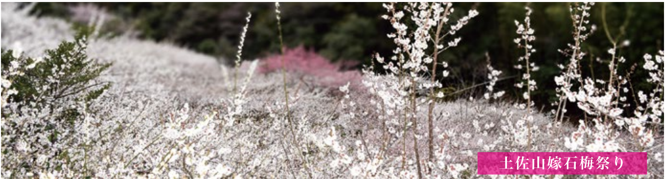
土佐山嫁石梅祭り

TEL 088-882-3839 e-mail kochi-sc@sjc.ne.jp