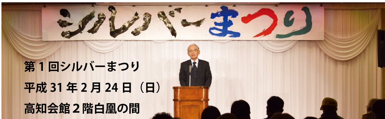
第1回シルバーまつり 平成31年2月24日(日) 高知会館2階白凰の間