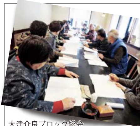
大津介良ブロック総会