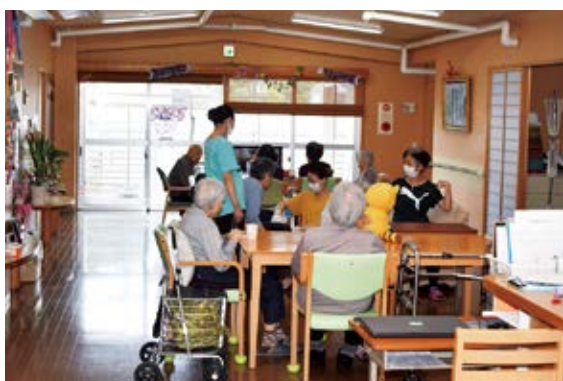
入居者さんたちの楽しい昼食タイム

施設長によるとお2人とも頑張ってくれていると好評価です。「人と関わり合いながら就業し、毎月の配分日を楽しみに頑張っています」と、笑顔で取材に応じていただいた会員さんでした。(吉村・池田)