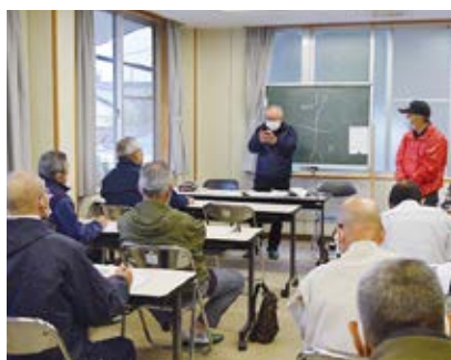
森林救援隊の講師がテキストにそって座学を進めています。

こうち森林救援隊から3名の講師が派遣され高知市シルバー人材センターの会員11名が参加しました。こうち森林救援隊は高知市の森林保全のために森林ボランティア活動を展開している団体です。当日は朝から雨天で、午前の座学が終了し昼休憩の頃には雨脚が強くなりました。その為、午後からの野外での実技講習は中止となり、引き続きテキストにそって、刈払機の取り扱いの説明、操作時間による点検作業、整備の仕方、作業時間の規定、作業中の安全規定などより細かな講習がありました。刈払機を分解し、その構造や整備の仕方、部品