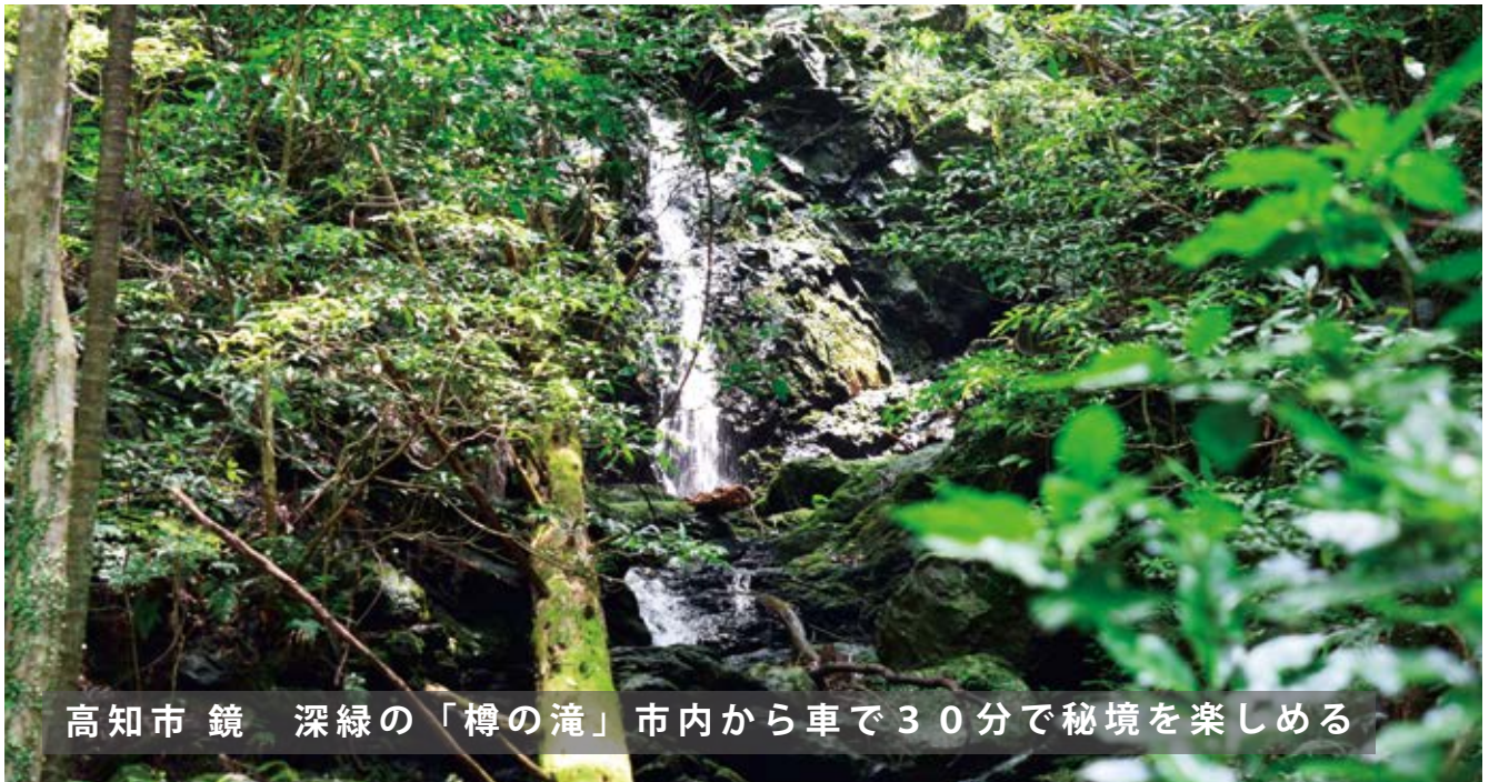
高知市 鏡 深緑の「樽の滝」市内から車で30分で秘境を楽しむ