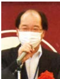
松島 研 高知市副市長

高知市副市長の松島でございます。本来であれば、市長からご挨拶を申し上げますべきところでございますが、本日はあいにく出張のため出席ができませんので、市長から預かってまいります。