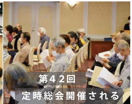
第42回 定時総会開催される