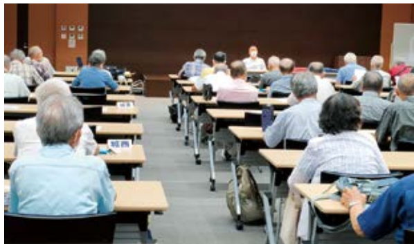
7月28日(木) ちよテラホールにて活発な意見交換が行われました。