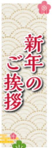
理事長 古味 勉