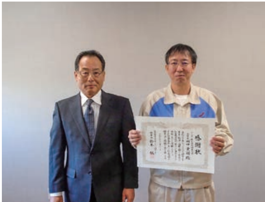
理事長より感謝状と記念品を贈呈

※継続実績年数、就業延べ人員、総合契約額、請負実績、派遣実績が顕著な発注者様 (平成5年～令和5年3月時点)