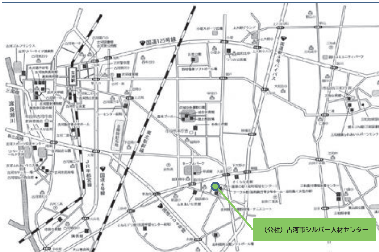
(公社) 古河市シルバー人材センター