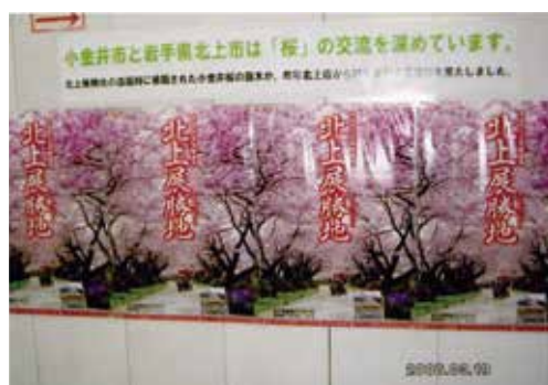
武蔵小金井駅に掲示されたポスター

また、当時の武蔵小金井駅長は、多くの人に小金井ザクラを知ってもらいたいと尽力しました。その結果、JR東日本も桜を通じた両市の交流を応援のため、2008年3月、駅構内に北上展勝地公園の桜と、小金井・北上両市の交流を紹介するポスターを大々的に掲げましたので覚えている方も多いと思います。