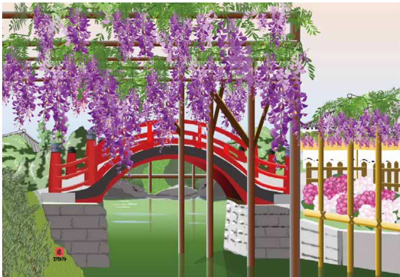
藤棚のある風景（エクセル画）