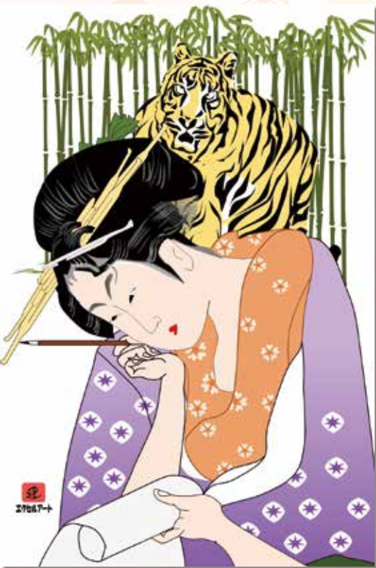
初夢 本町 大島 健雄