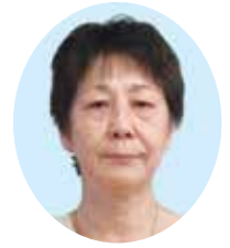
本町 本道 若子

今年寅年。「虎は千里行って千里帰る」と言いますが、歳女とは言えさすがにシルバーの年齢となつて一日往復二千里は厳しいものがあります。