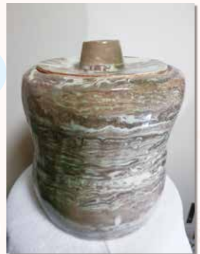
壺 緑町 平野 武