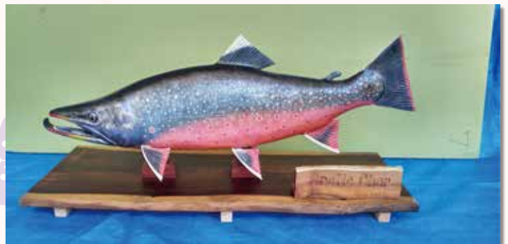
Arctic char 貫井北町 高野 清