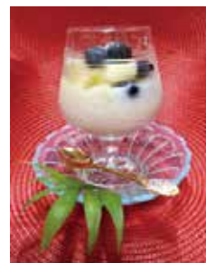
ヨーグルトのように