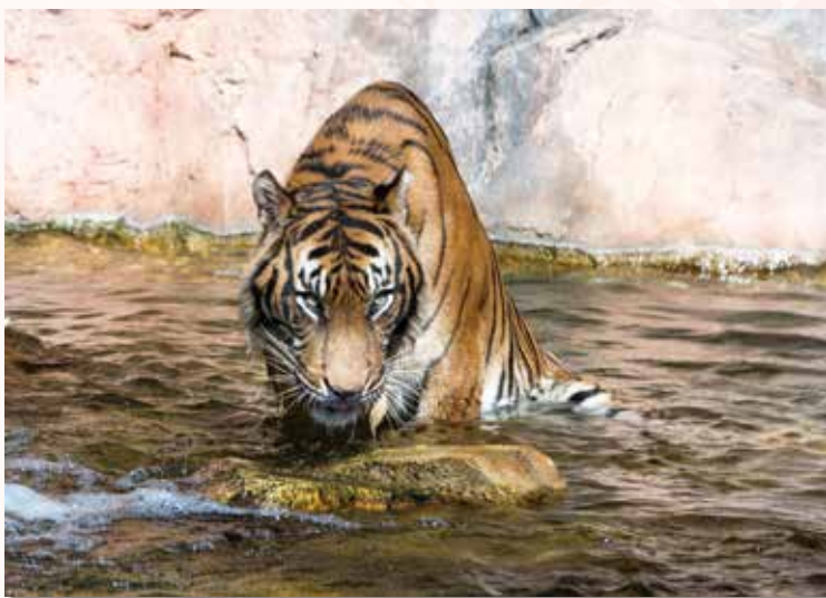
水の江 (みずのえ) 虎 中町 伊東 浩