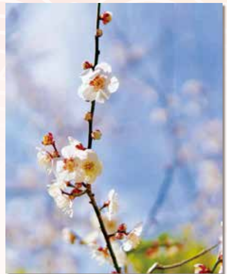
春をまつ白梅 貫井南町 沼尻 憲司