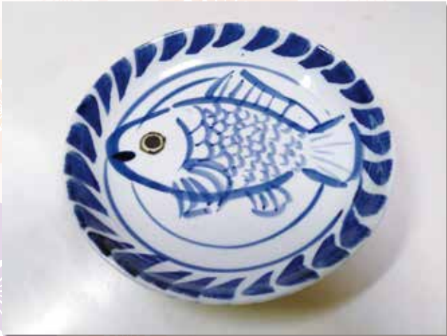
タイ焼き模様の砥部焼 本町 本多 隆志