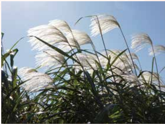
武蔵野公園ススキ 前原町 松本 幸夫