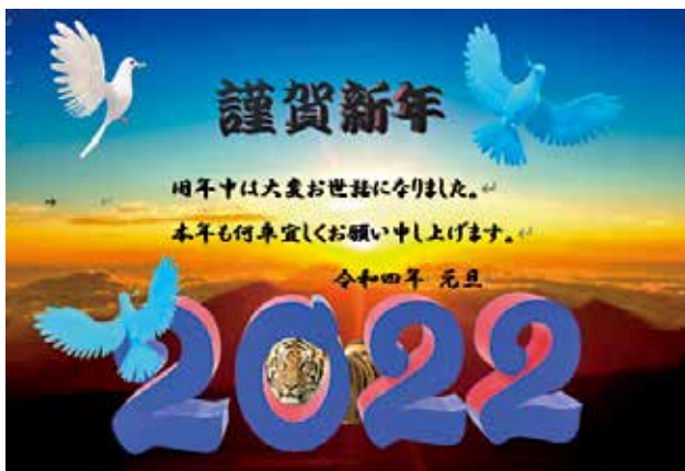
CoCoパソコンサロンにて作成

私も、今年7回目の「寅年」を迎えましたが、未だ入院歴もなく、日々を追いかけていることに、丈夫に生んでくれた両親や、結婚56年間を支えてくれている妻に感謝したいと思います。これからもゴルフや園芸・PCタイムの生活を楽しむためには、健康が第一！と実感しております。