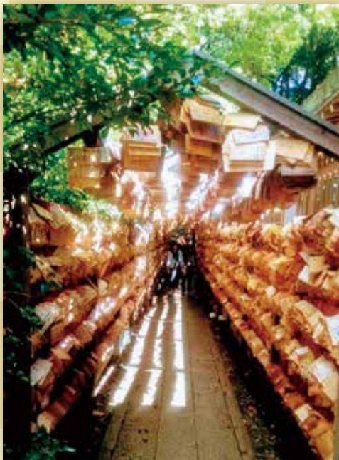
写真「絵馬に願いをこめて」 本町 檜森 正子