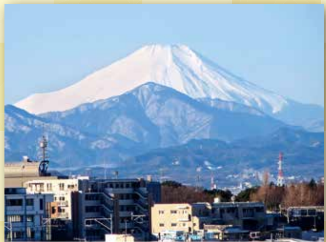
写真「雪晴れに富士」 本町 本多 隆志