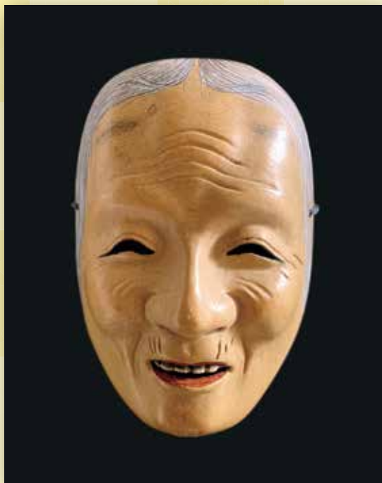
狂言面「姥(うば)」 貫井南町 依田 孝志