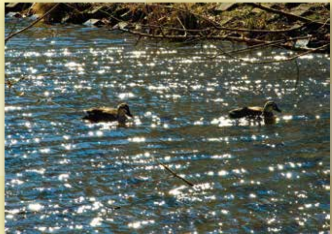
写真「野川の春光」 本町 大島 建雄