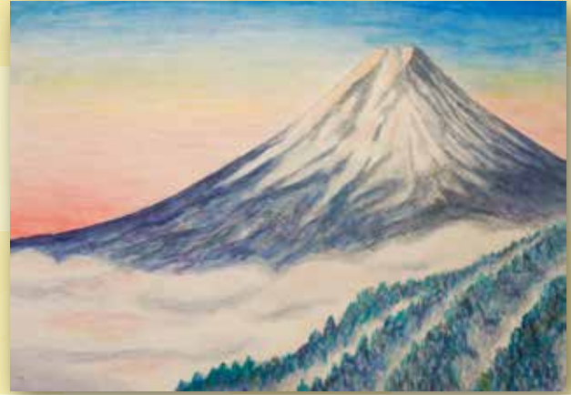
絵画「雲上に 鶺鴒色の富士 初日の出」 貫井北町 土屋 文雄