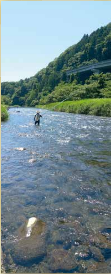
写真「盛夏の中津川」 貫井北町 高野 清