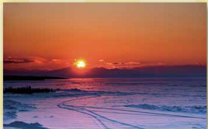
写真「雪原の夕日」 中町 伊東 浩