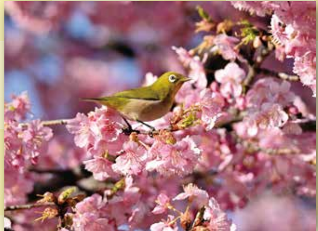
写真「春来たる」 緑町 戸上 鉄男