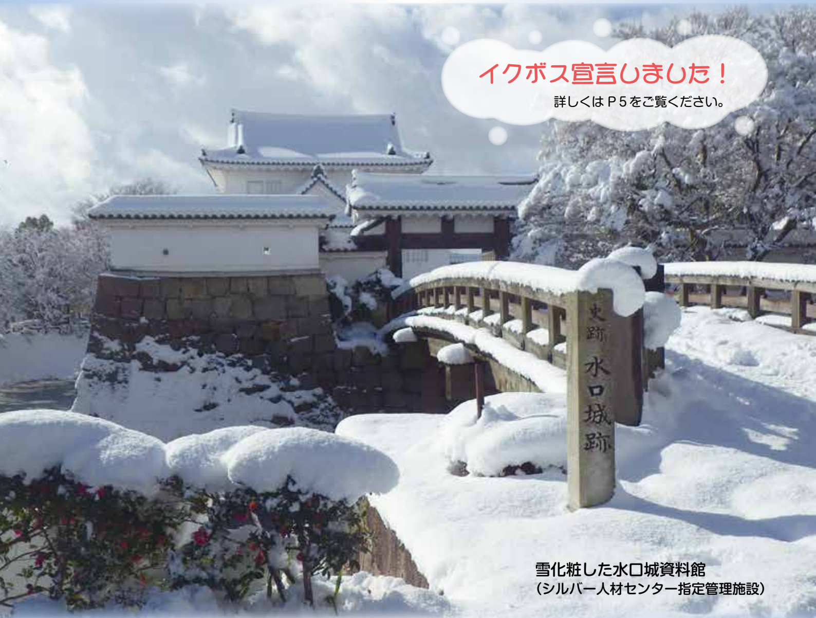
雪化粧した水口城資料館 (シルバー人材センター指定管理施設)

発行 公益社団法人 甲賀市シルバー人材センター広報部会 〒528-0035 滋賀県甲賀市水口町名坂 830-1 TEL.0748-63-0872 FAX.0748-62-9794 E-mail koka@sjc.ne.jp HP http://webc.sjc.ne.jp/koka/