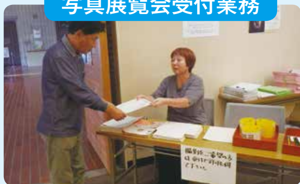
写真展覧会受付業務

会員324名参加のもと市内各地域において清掃ボランティア活動を実施。 天候に恵まれ多くのゴミを回収しました。