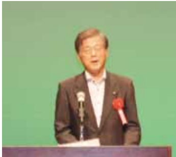
的場甲賀市議会議長