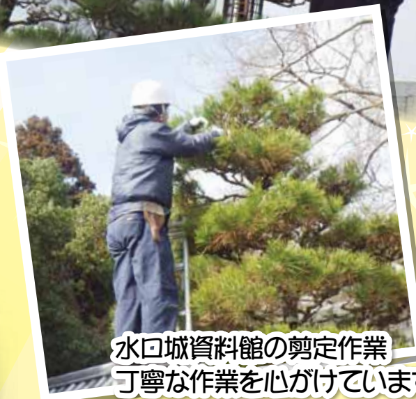
水口城資料館の剪定作業 丁寧な作業を心がけています。