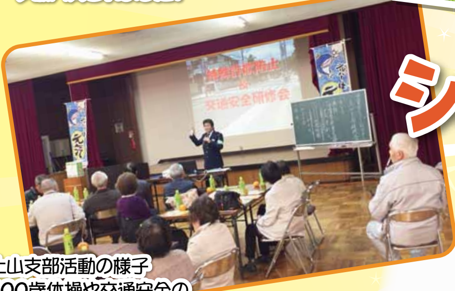
土山支部活動の様子 100歳体操や交通安全の 講習を受けました。