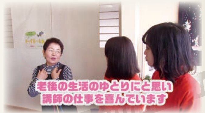
老後の生活のゆとりにと思い講師の仕事を楽しんでいます

お花の講座に来ることで友達に出会えて、話をする事でストレス解消にもなり、講師の方は現役時代の経験を活かすことができます。