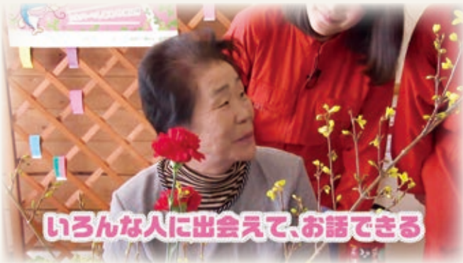
いろんな人に出会えて、お話できる