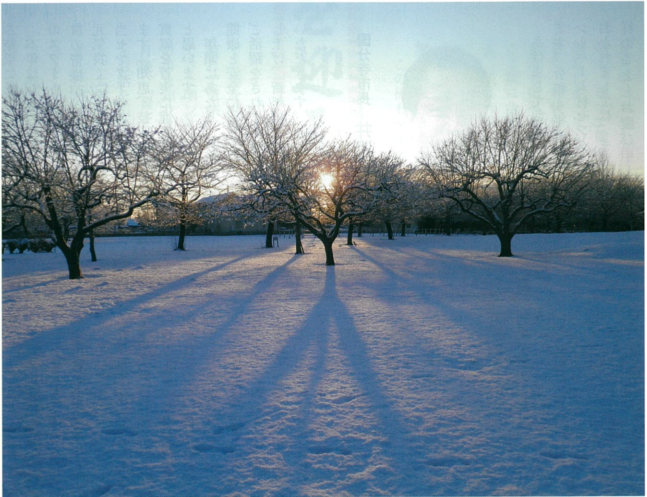
武蔵国分寺跡（富田健治会員）

公益社団法人 国分寺市シルバー人材センター 〒185-0003 国分寺市戸倉4-14 ☎ 042(325)4011