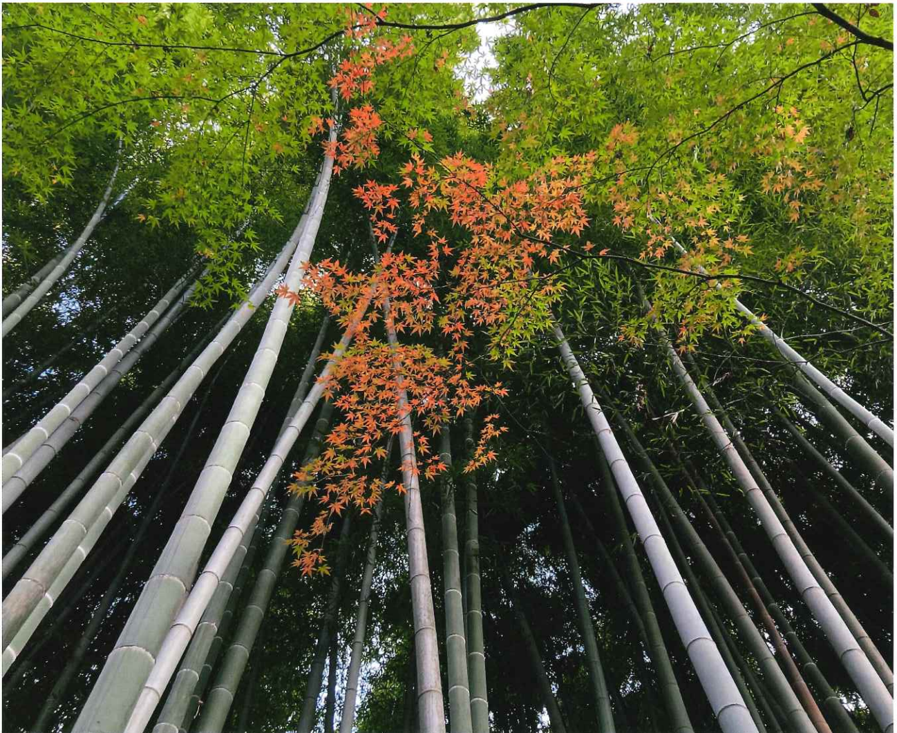
殿ヶ谷戸庭園内の竹林と紅葉 (安田雅澄会員)

公益社団法人 国分寺市シルバー人材センター 〒185-0003 国分寺市戸倉4-14 ☎ 042(325)4011