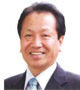
国分寺市長 井澤 邦夫

結びに、本年も会員の皆様におかれましては、健康と安全に留意され、更なる御活躍をお祈り申し上げますとともに、シルバー人材センターのますますの発展を祈念し、新年のごあいさつとさせていただきます。