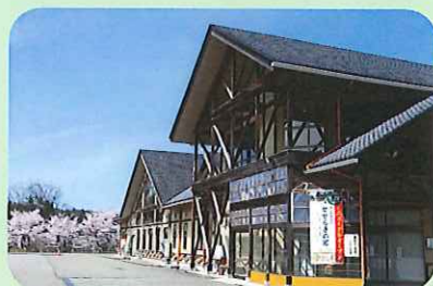
里山健康学校せせらぎの郷