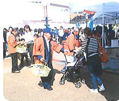
昨年の街頭キャンペーン (どんどんまつり会場)

会員・就業開拓部会では、10月8日（日）に開催される「どんどんまつり会場」にて、部会員が中心にポケットティッシュ等を配付し、センター事業のPRを実施します。