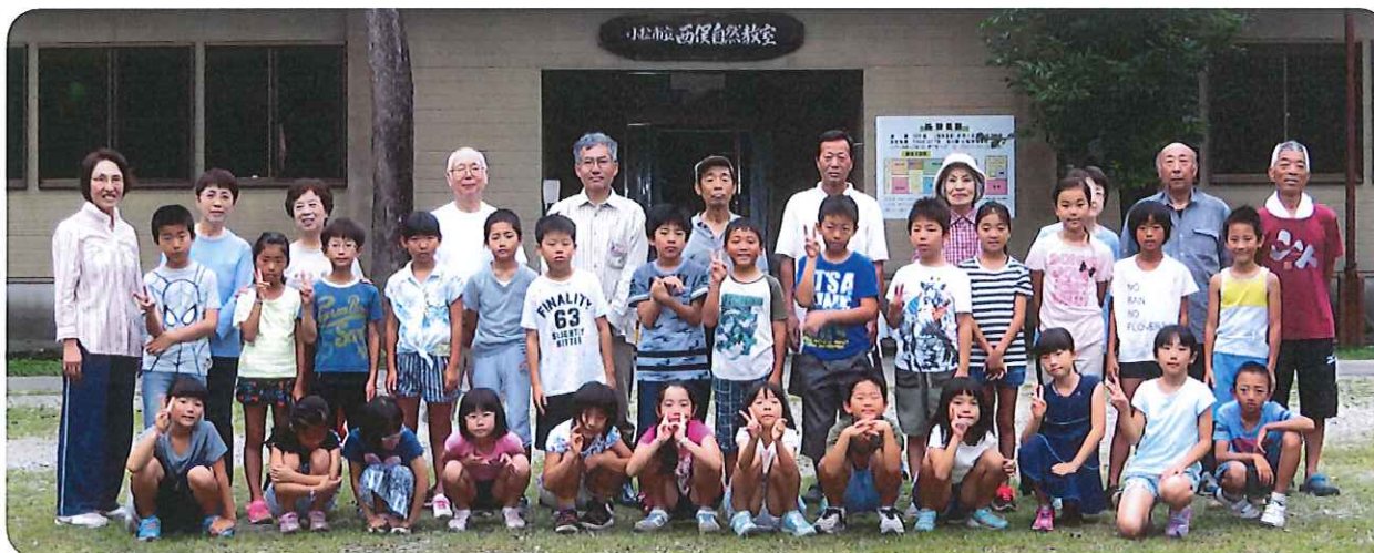
西俣自然教室の合宿