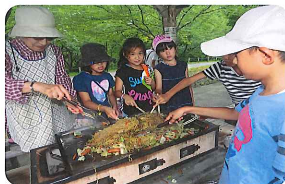
せせらぎの郷での焼きそば作り