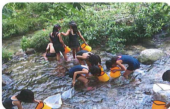
西俣川での川遊び