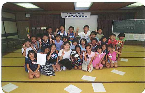
国際交流（中国出身の国際交流員と交流）

小学3・4年生を対象に夏休みの5日間を小松の自然や伝統文化を体験する教室で、第1期は24名、第2期は26名の合計50名の参加があり、教員OBの会員や専門の外部講師やボランティアの方々の協力により無事終了いたしました。今回は、センター、西俣自然教室での合宿の他にせせらぎの郷でも焼きそばを作りました。