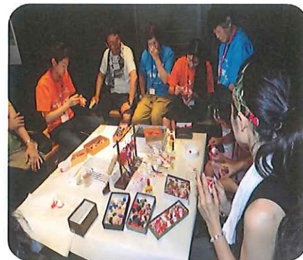
日用町の古民家「ウイズダムハウス」において小物作りで交流しました。