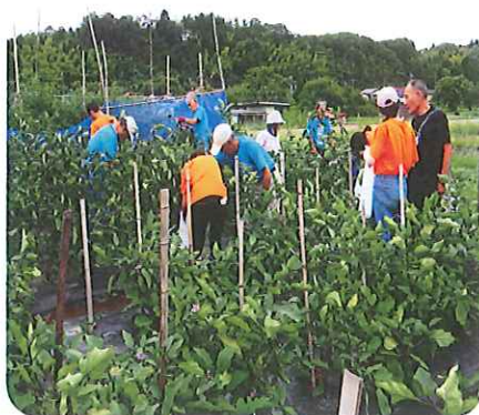
なす・ミニトマトの収穫体験で交流しました。