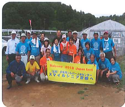
花坂町のスマイルシニア農園

留学生交流文化体験プログラム「ジャパンテント」に協賛し、8月24日、25日農園会員及び和服リフォーム会員が留学生と楽しく交流しました。