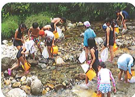
清流西俣川での川遊び