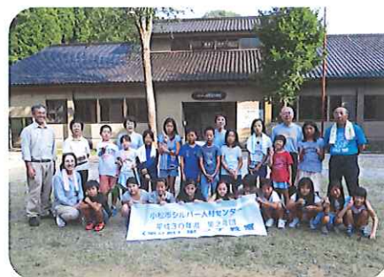
西俣自然教室での宿泊