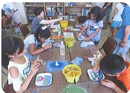
九谷焼き絵付け体験

平成3年から実施してきた「里っ子教室」も今年で28回目となりました。小学3・4年生38名が、夏休みの5日間、センターの会員や外部講師と共に小松の素晴らしい自然や伝統文化に触れ合い、やさしさ・思いやり・助け合いを醸成しました。