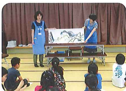
絵本の読み聞かせ