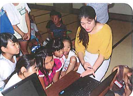
国際交流員との交流