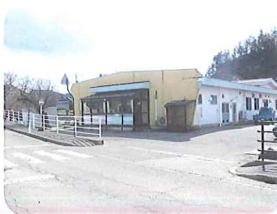
移転先の旧中海保育所 (小松市軽海町ノ25-1)