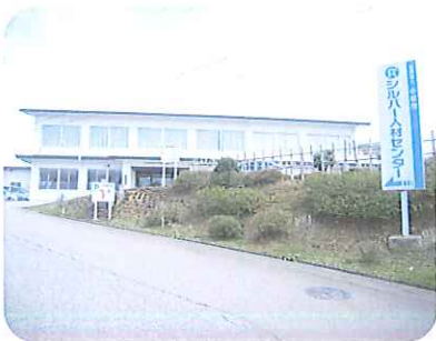
現在のセンター (小松市正蓮寺町セイ谷10番地)

事務所が入っている高齢者生産活動センターが、当初の高齢者による生産活動や技術指導等の役割を終えている事と施設の老朽化及び新耐震基準になっていない等の理由により、平成31年3月31日を以って廃止されることとなり、移転先を市所有施設で比較検討した結果、旧中海保育所へ移転する事になったものです。