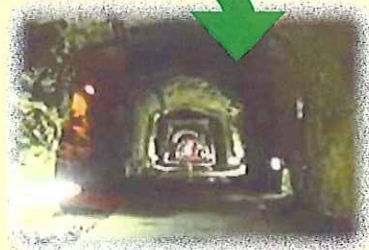
④ 尾小屋鉱山資料館見学 14:30～15:40