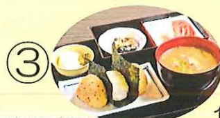
③ 道の駅木場湯 で昼食 （おにぎりセット） 12:30～14:00