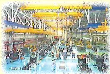
① コマツ栗津工場見学 9:20～10:50