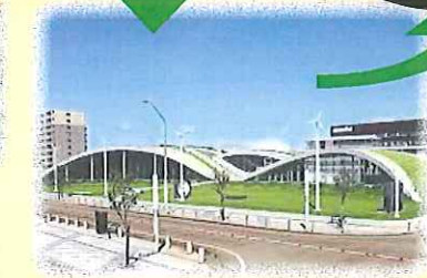
② サイエンスヒルズ 3D・VR体験見学 11:10～12:20