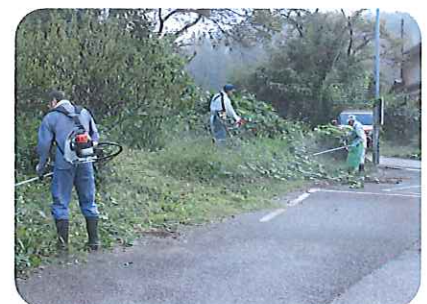
9月28日実施の東部地区奉仕作業に取り組む会員（13名）