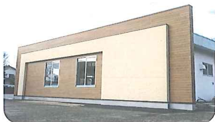
県道沿いから見た事務所

3月23日（月）、リニューアルされた軽海町の旧中海保育所に事務所を移転する事になりました。広い駐車場を確保しましたので、お気軽にお立ち寄りください。