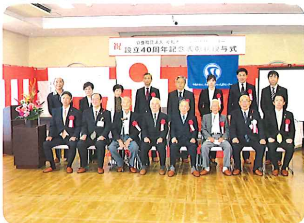
受賞者の方々の記念撮影