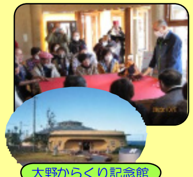
大野からくり記念館