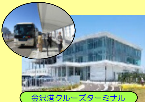
金沢港クルーズターミナル