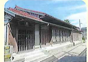
旧米谷銀行(吉祥庵)