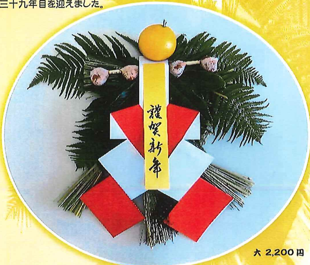
大 2,200 円