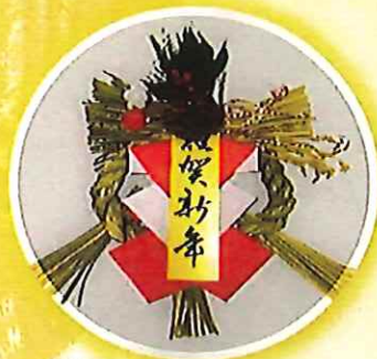
三 1,000 円