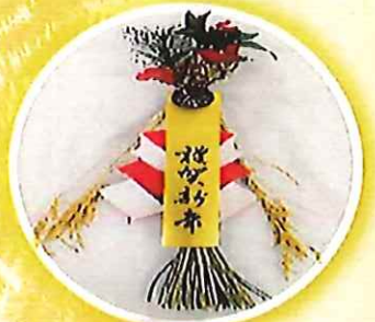
樽罎 1,000 円