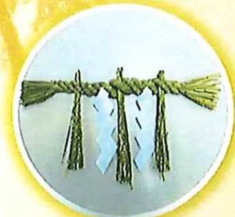
一文字 500 円から