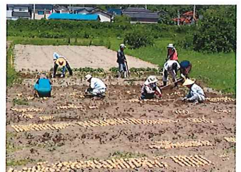
ジャガイモの植付け