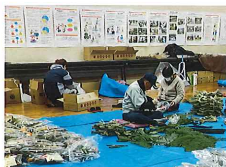
しめ飾りの飾り付け